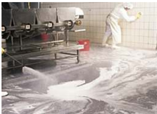
Slika 3. Prikaz pranja pogona pjenom