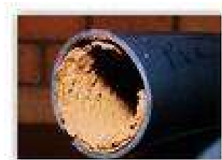
Slika 1. Neke vrste onečišćenja

Da bi se uspješno provelo čišćenje, potrebno je "poznavati" vrste onečišćenja i na osnovu toga upotrijebiti pravilno sredstvo i sustav za čišćenje (Scheffler, 2009.).